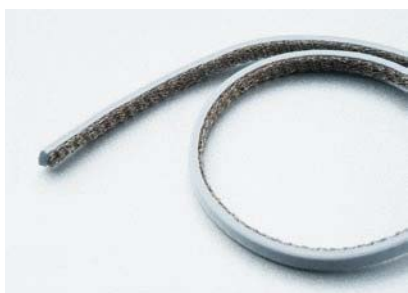
複合タイプ Compound Type