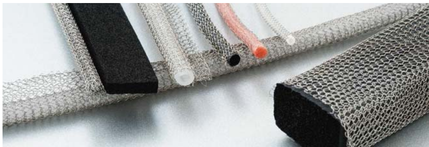
シリコン芯材 Silicone Core